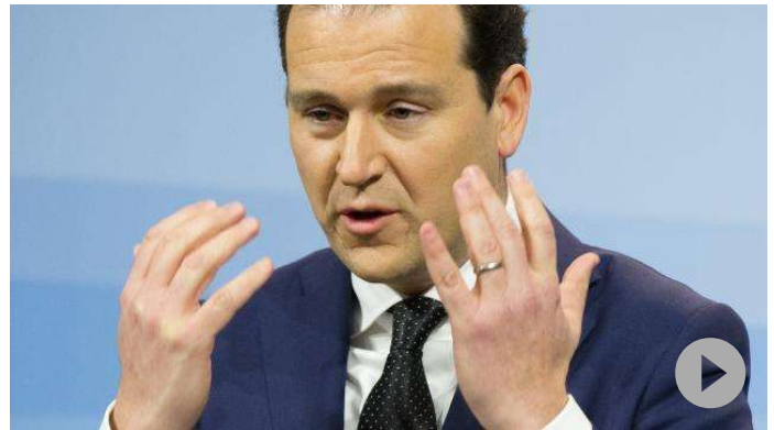
Asscher neemt vragen in inburgeringsexamen onder de loep